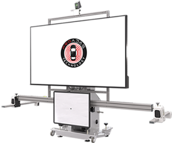
PROADAS RS DIGITAL