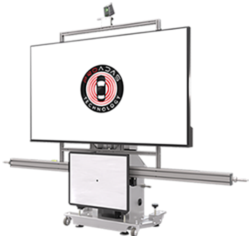
PROADAS TS DIGITAL