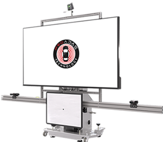
PROADAS START DIGITAL